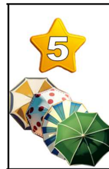
Carta de puntuación final