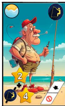
Carta de personaje