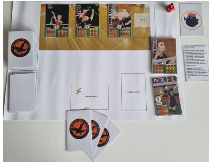
Tapete y componentes de uno de los jugadores