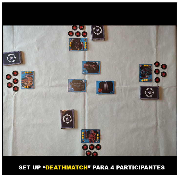
SET UP "DEATHMATCH" PARA 4 PARTICIPANTES

¿Alguien cumple los requisitos de victoria? Si la respuesta es NO volvemos al paso (1) dando inicio a una nueva ronda.