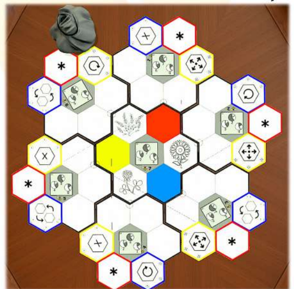
Componentes en TTS