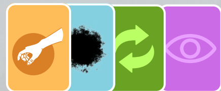
14 cartas de ACCIÓN