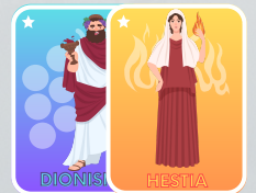
2 cartas COMODÍN