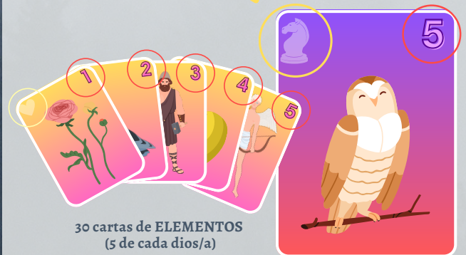
30 cartas de ELEMENTOS (5 de cada dios/a)