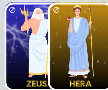
2 cartas DISRUPTIVAS