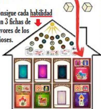
TABLERO DE JUGADOR

Consigue cada habilidad con 3 fichas de Favores de los Dioses.