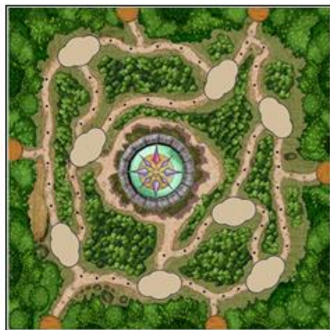
TABLERO DE JUEGO