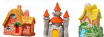
FIGURAS DE TEMPLOS