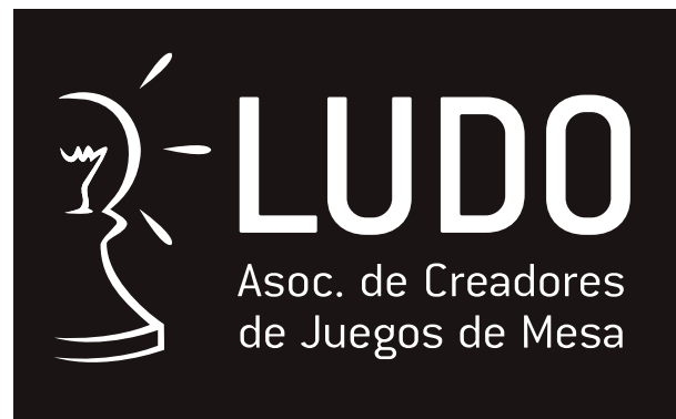
Versión monocromo negra y blanca